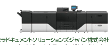
京セラドキュメントソリューションズジャパン株式会社 インクジェットカラープロダクトプリンター TASKalfa Pro 15000c

株式会社ウチダテクノ AeroDieCut（透明素材対応） 帯掛機 TP-WXII Pen 計数機EZC250 計数機AISOR