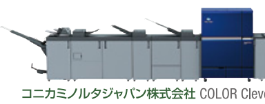
コニカミノルタジャパン株式会社 COLOR CleverPress C14000

桜井株式会社 カードプリンターGRASYS 武藤工業株式会社 大判インクジェットプリンタ多目的印刷 MPインクValuejet VJ-1628MH